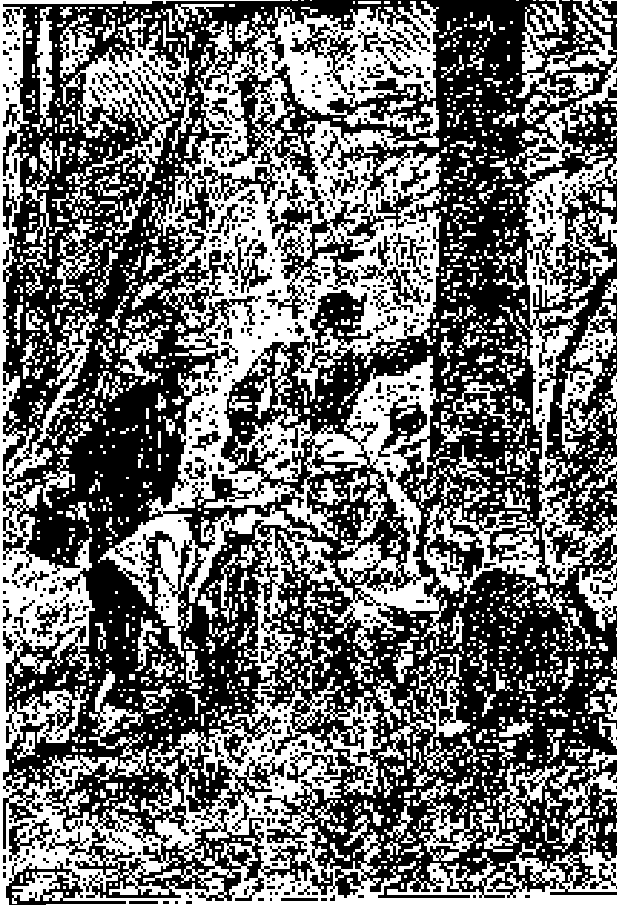
El árbol que servía en Jago de agricultura local.

Serios peligros amenazaban a French-den , expuesto a los ataques de siete malhechores vigorosos y armados. El interés de Walston era sin duda alguna marcharse cuanto antes de la isla Chairmán ; pero si llegara a sospechar la existencia de una pequeña colonia, bien provista de cuanto carecía