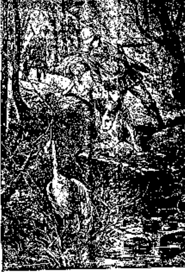
El paisaje es todo un mundo.

Briant dio tres golpes prolongados, y escuchó, esperando que aquellos atolondrados muchachos le