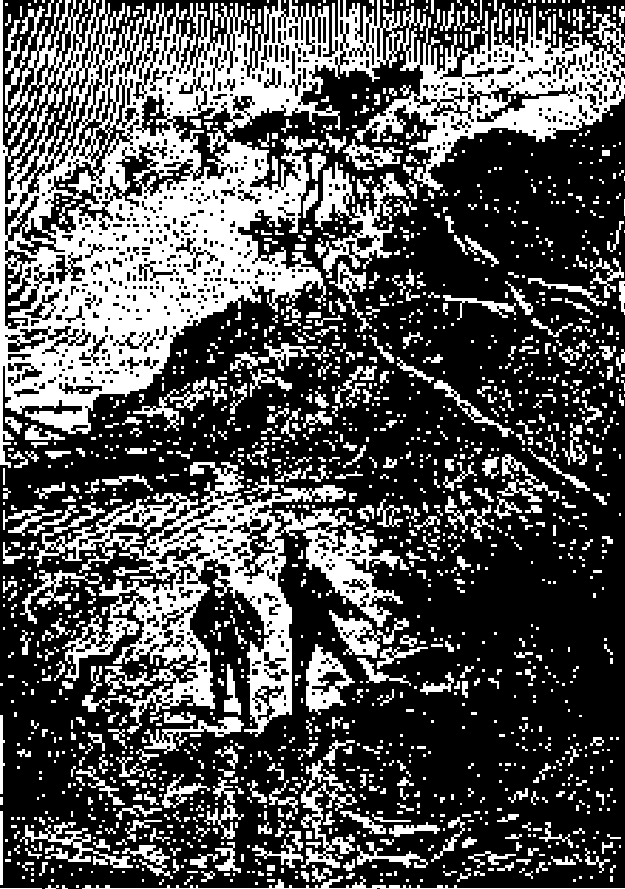
Detalle de una de las escenas que se ven en el libro.

Sólo Santiago Briant, que era antes el diablillo del colegio Chairmán, continuó triste y aislado de sus compañeros.