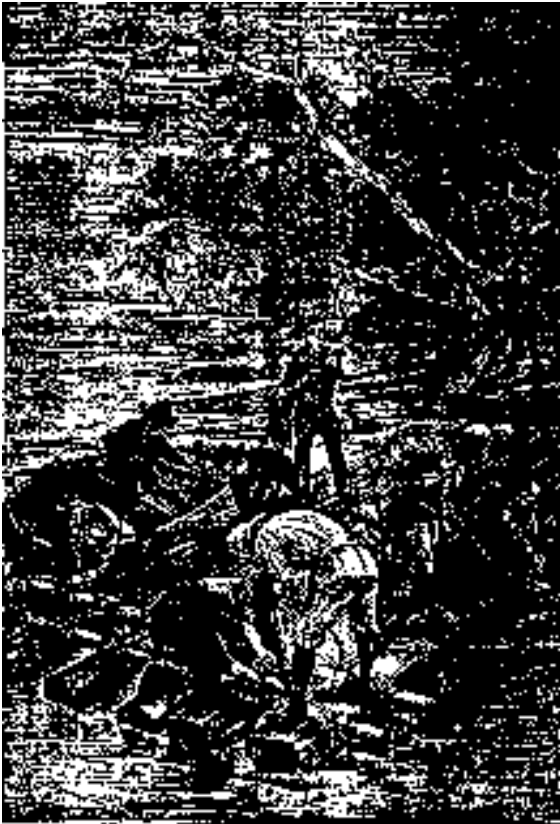
Los indígenas construyeron una aldea, etc.

El niño, después de darle una palmadita en el hombro en señal de buena amistad, fue a reunirse a sus compañeros, y Briant dio a todos ellos orden de que no se alejaran, con el fin de no perderlos de vista.