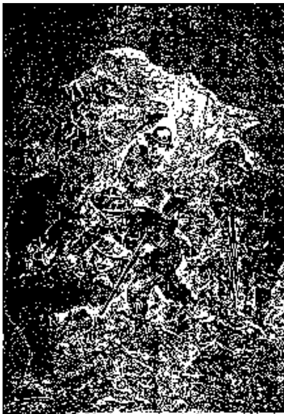
Un grupo de viajeros en un momento de la expedición.

Aquel lago presentaba dimensiones considerables, puesto que un horizonte de cielo le encerraba en las tres cuartas partes de su perímetro; era, pues, admisible que estuviesen en un continente, y no en una isla.