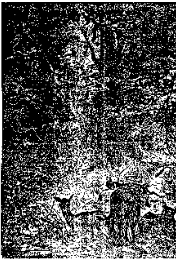
El niño hizo la boca como un río

¡Cuántas muecas hizo! Sus compañeros reían a carcajadas al verle escupir la abundante saliva que el ácido de aquella fruta le producía.