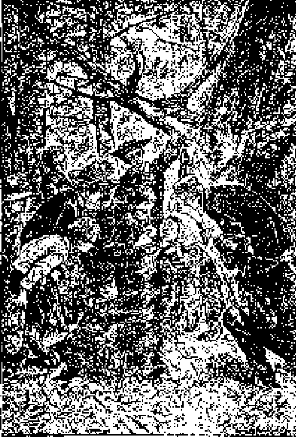
La mejor salida encontrada

Cuatro compañeros más, y no de los menos vigorosos, servirían mucho para la defensa; pero no