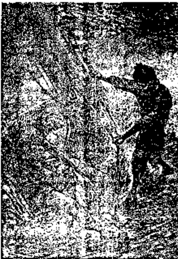
Urmas y otros, observando la gran cámara.

Contiguo al salón se encontraba una gran cámara, luego el comedor, y después la habitación de los tripulantes.