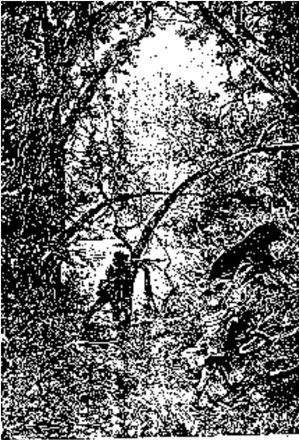
En el interior de las montañas.

-¡Ya volverán, Briant, y más pronto de lo que ellos creen! Por más terco que sea Doniphan, las circunstancias podrán más que él. Apostaría cualquier cosa a que antes de los fuertes fríos estarán de vuelta en French-den .