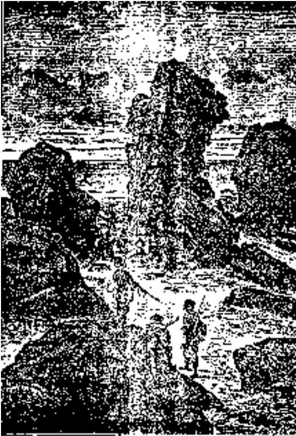
Contemplando, en un momento de calma, su gran obra de arte.

Doniphan, no obstante, no tenía mayoría entre sus compañeros; los más pequeños, especialmente, no parecían dispuestos en su favor, ni tampoco en el de Gordon.