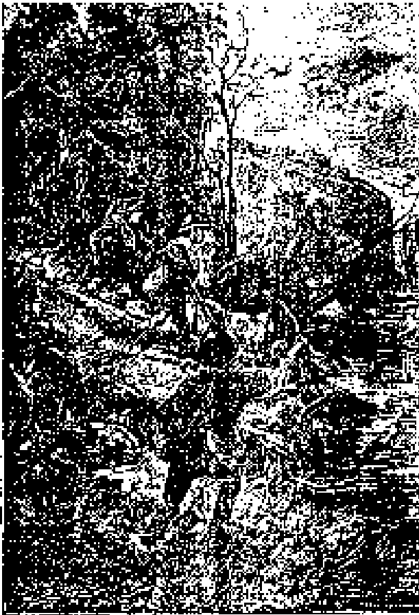
Los árboles crecen altos por las orillas del lago.

Pero ¿no era posible que dicho lago perteneciera a una isla, y que, prolongando la expedición más allá, es encontraran tal vez con un verdadero mar, sin ningún medio de atravesarlo?