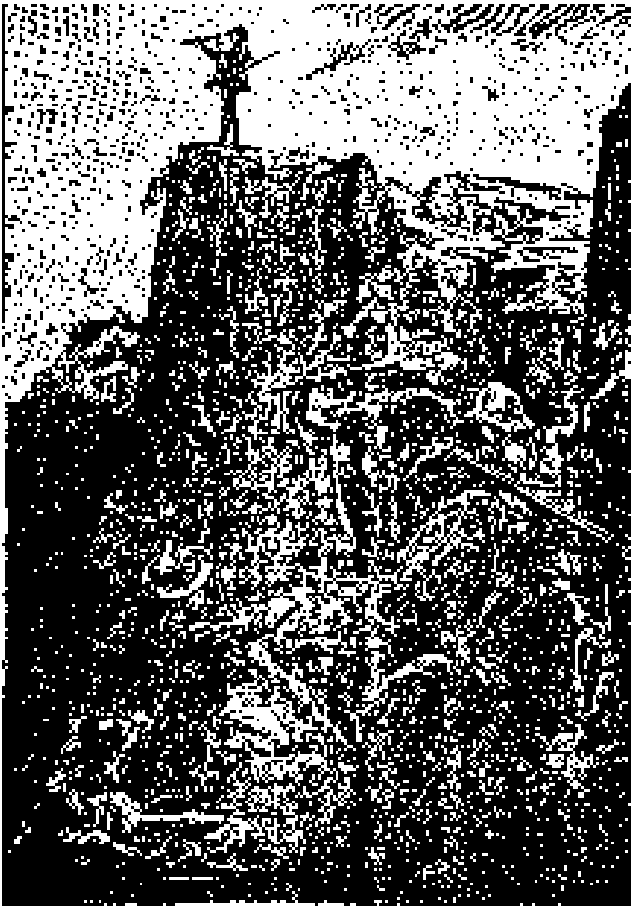
Doniphan. Fué el primero que salió á la conquista de las montañas.

no se podía desperdiciar el tiempo, Doniphan resistió a la tentación, absteniéndose de tirar un solo tiro. El mismo Phann llegó a comprender que sus idas y venidas eran inútiles, concluyendo por no apartarse sino algunos pasos delante de sus amos, reconociendo el terreno.