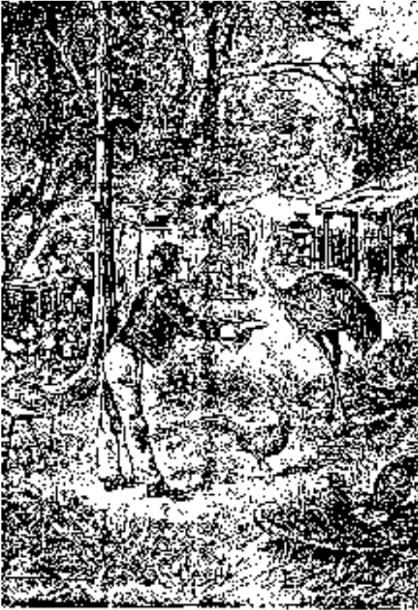
A parte de los animales que se crían en el país.

Ocuparon toda la tarde en una tarea que no dejaba de ser repugnante; pero como era indispensable, todos se pusieron resueltamente a la faena. En primer lugar, era necesario transportar todas las focas a la arena, lo que no dejó de ser algo penoso, porque aquellos animales, de regular tamaño, pesaban mucho.