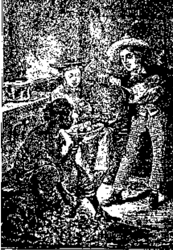
Mrs. G. G. G. G. G.

mal gusto, y advertía con algunas gotas de brandy, constituyeron esta comida, bastante aceptable.