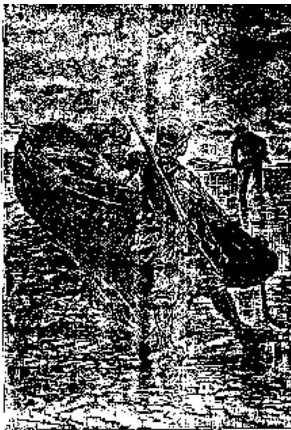
La curiosidad sobre Yoda.

La causa de aquella orden fue la extraña conducta de Phann , que llamó la atención del jefe de la colonia. El inteligente animal iba precipitadamente hacia el bosque, lanzando tan quejumbrosos ladridos, que en verdad no podían menos de sorprender a los colonos.