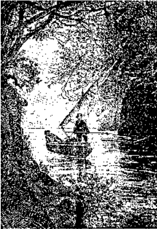
El bote de Phann en el pantano.

Phann los acompañaba; pero como el fiel animal no temía mojarse las patas, saltaba regocijado por los charcos de agua.