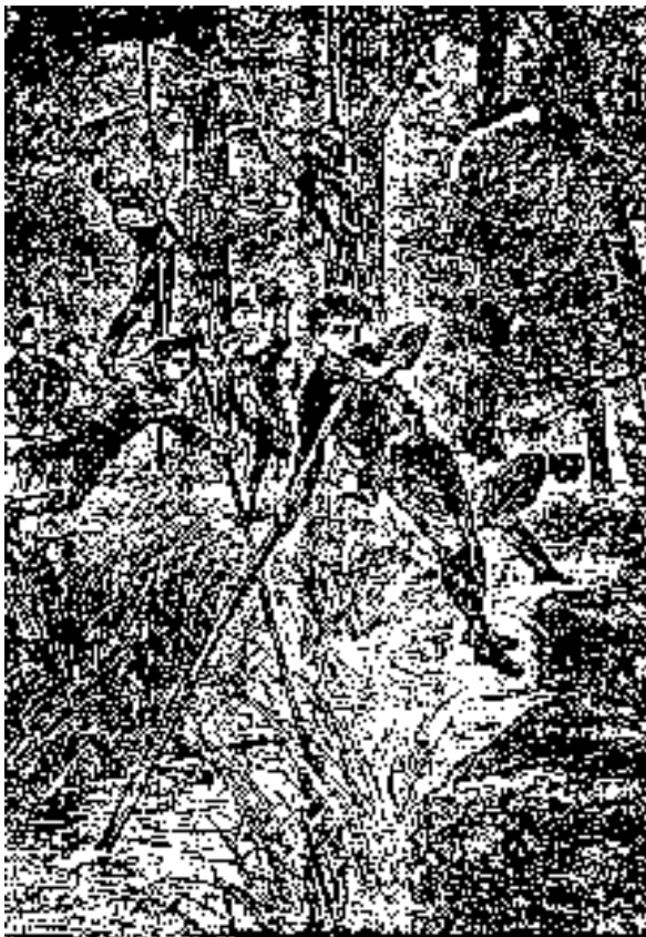
Hallazgo: un gamo atrapado, agarrado en un largo palo.

lo regular, en los bosques frecuentados por gamos, y no es raro que produzcan buenos resultados.