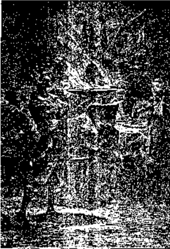
Mokó trabajando en el taller.

Quando el grumete supo que iba a trocar sus funciones de cocinero por las de patrón de canoa, no pudo ocultar su alegría, y, sobre todo, siendo para acompañar a Briant, a quien profesaba un entrañable cariño.