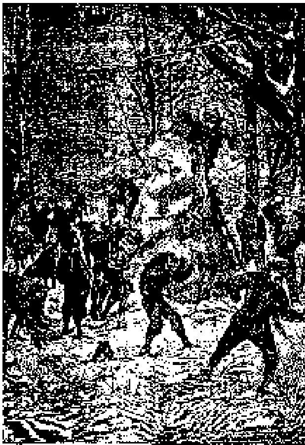
Sección y Carlos trabajando en la refinería de salmuera muy grande.

que tenía en salmuera; pero no debe olvidarse que French-den encerraba quince personas que alimentar, asistidas de un apetito propio de muchachos de ocho a catorce años.