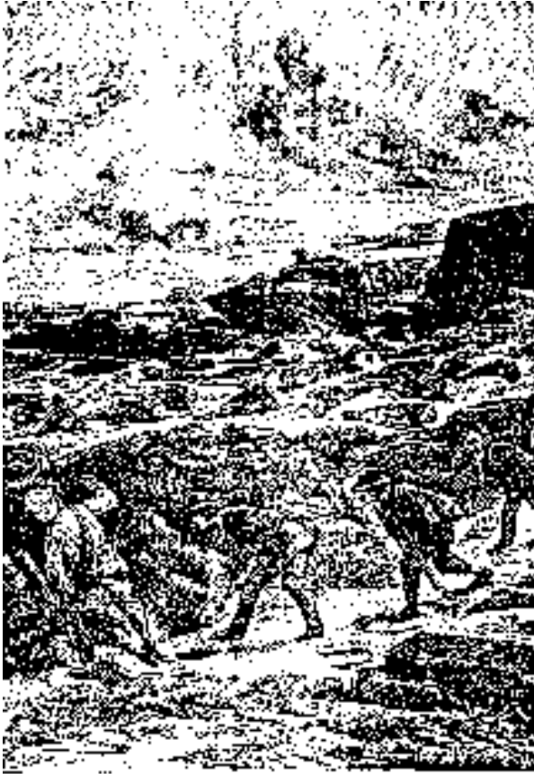
El paisaje descrito en estas páginas.

-¡Todas las preferencias son siempre para él! ¿No es verdad, Gordon?