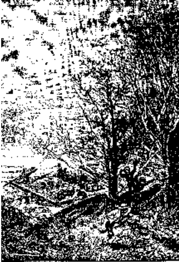
El bambú, se ve en el fondo de la imagen de los paganos.

-¿Lo oyes, Phann ? dijo Service, volviéndose hacia el perro. Hay fieras aquí.