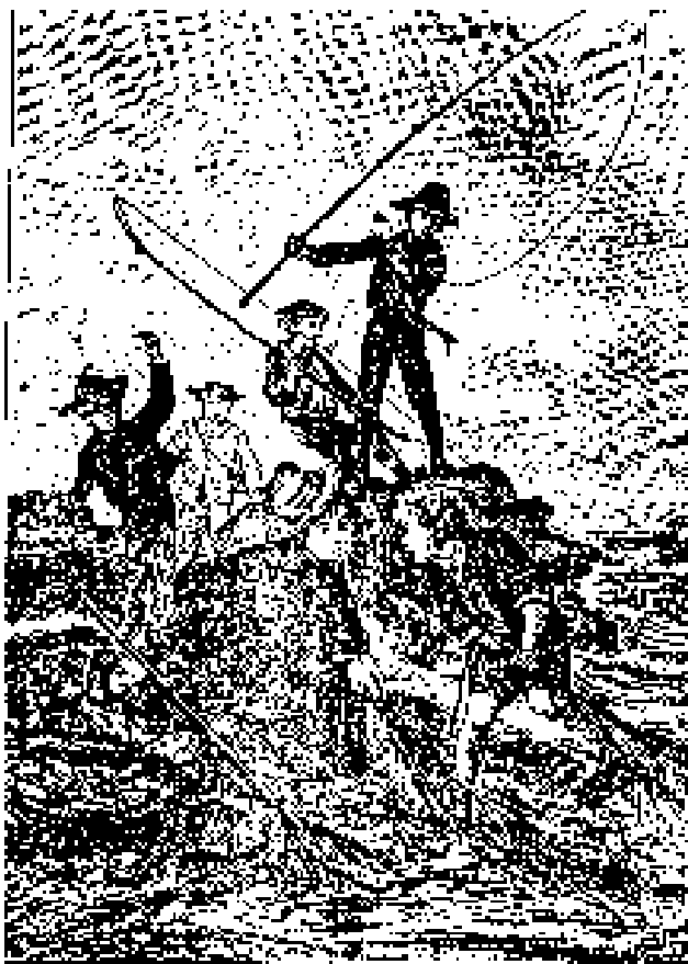
—Petro ya no puede... responde Goshka.

podía, en un caso dado, ser transportado con rapidez al abrigo de los árboles.