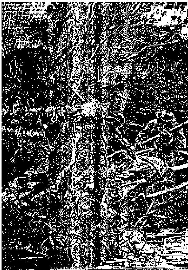
resillago durante el viaje a la montaña del pueblo de Waltham.

El marino no juzgó prudente exponerse, en tales condiciones, a los peligros de una travesía nocturna, máxime cuando, teniendo el aire propenso a echarse, era muy probable que refrescase con los primeros