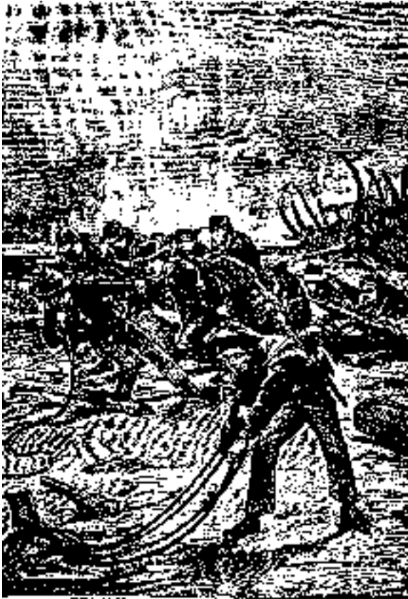
Reservados entre todos las piezas que quedaban del puente.

Cansadísimos después de tan laborioso día, cenaron con gran apetito y durmieron sin despertarse hasta la mañana siguiente.