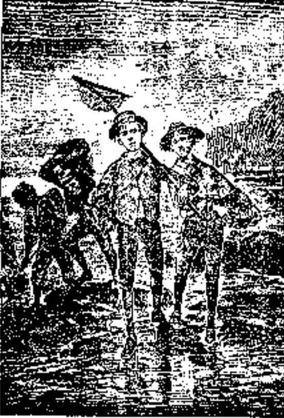
J. K. & Co. Paris.

Esto, por lo menos, se presentaba dudoso a los jóvenes náufragos.