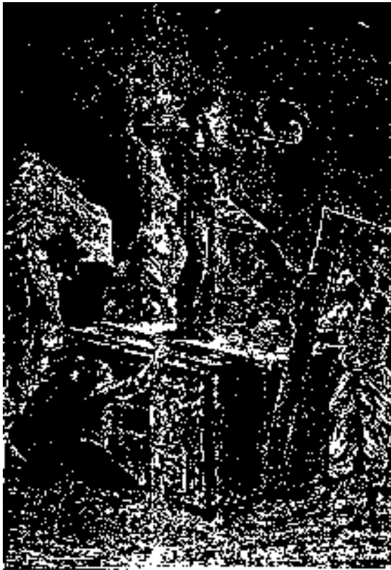
BOSQUE DE LOS SIERRAS PARA LOS SIERRAS Y LOS SIERRAS DE LOS SIERRAS.

Doniphan mató algunos de estos animales; pero como era bastante difícil aproximarse a ellos, el consumo de plomo y de pólvora no estaba en relación con los productos, con gran disgusto del joven cazador.