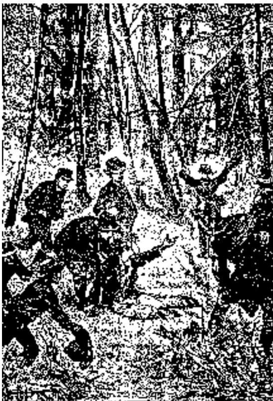
—(Q)UÉ PASABA EN EL CAMPAMENTO EN EL RÍO DE LA PARADA EN 1914.