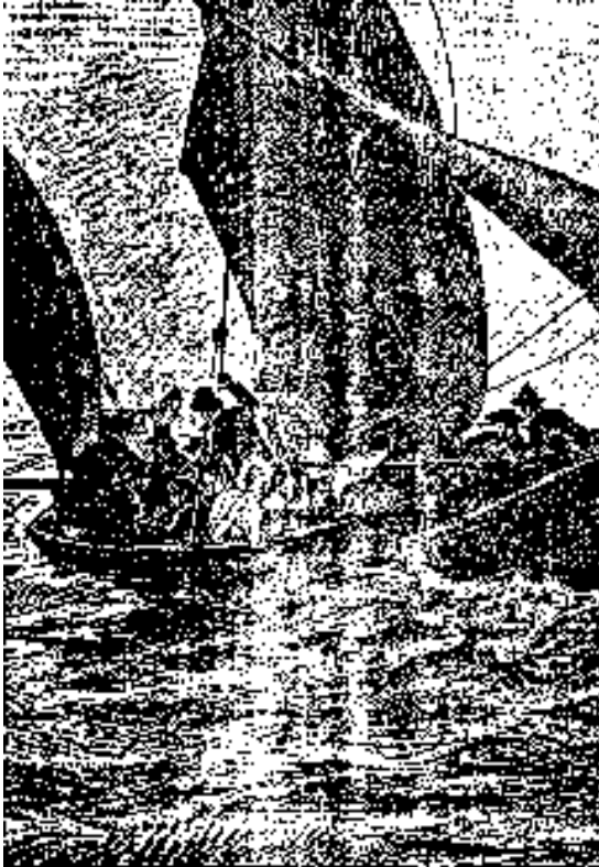
El tiempo les fue favorablemente

En cuanto a la excelente Kate, los Briant, los Garnett, los Wilcox y demás se la disputaban, pero