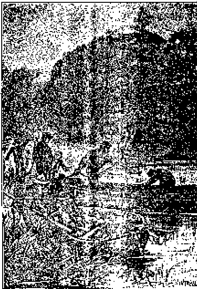
La roca y la gran cantidad de musgos.

más bien con la corriente del Zealand que con la brisa interceptada por la masa enorme de aquel acantilado, a quien habían dado por nombre Auckland-hill .