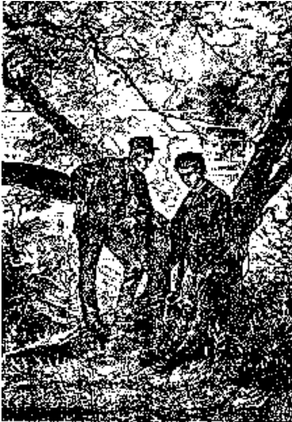
—¿Qué hora es ahora? preguntó Basilio—

en que está atada la cuerda; esto sentado, hubieran deducido fácilmente cual sería el poder ascensional de la cometa y la altura que podía alcanzar, no dejando de saber también la fuerza que habría de tener la cuerda para resistir la tensión; circunstancia muy atendible para la seguridad del observador.