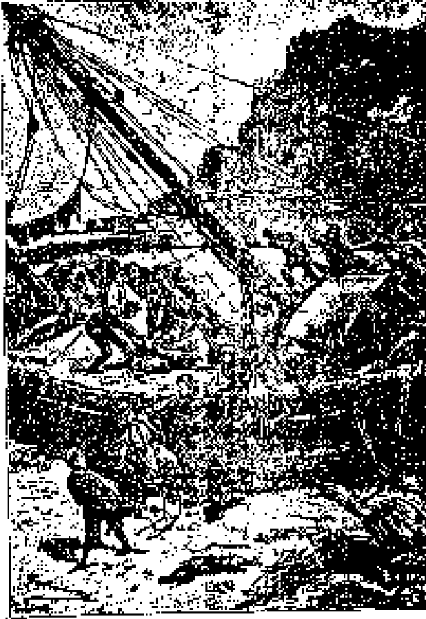
Preparación de cargar las mercancías del buque por las vetas.

El cargamento, dividido en paquetes, inscritos en la cartera del americano con su número de orden,