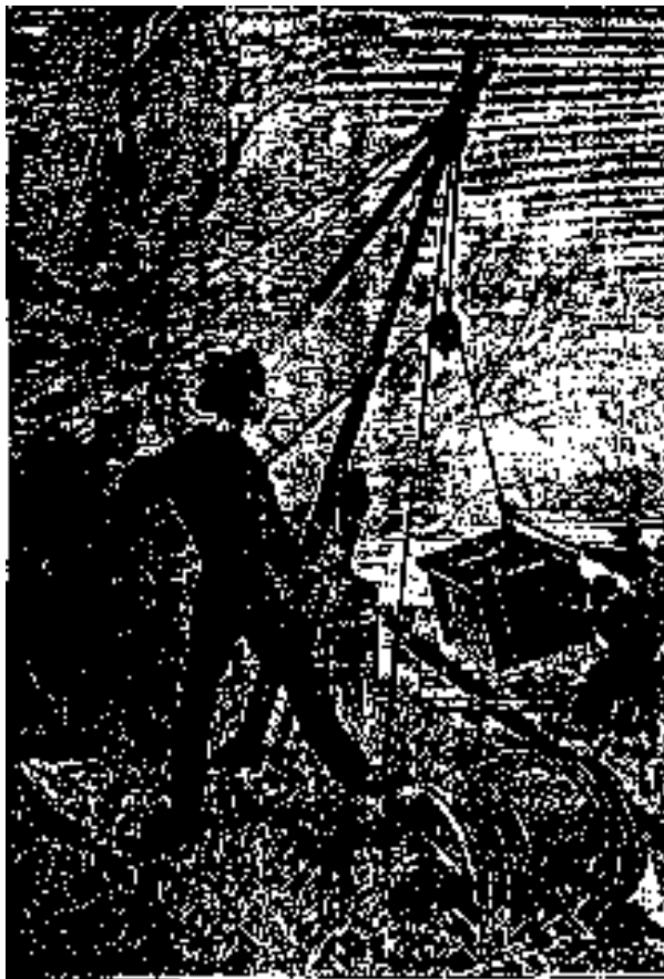
Alcator en un campo de cañales de la zona de...

-Si me conviene, señor pinche, replicó el altanero muchacho frunciendo el entrecejo.