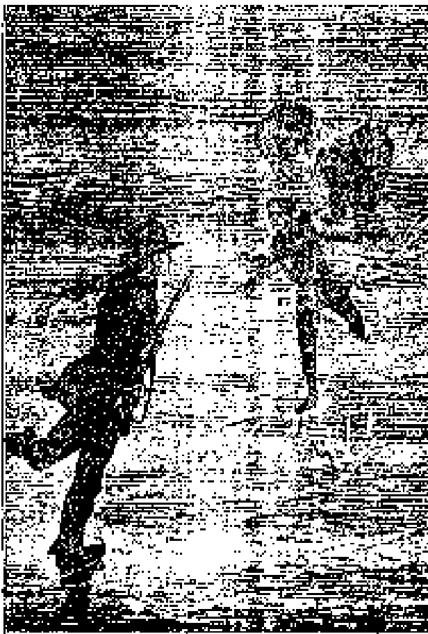
— Desolpheus empujó el cofre hacia él. —

-Jamás hemos dudado de ello, Briant, y desde mañana abandonaremos vuestra compañía.