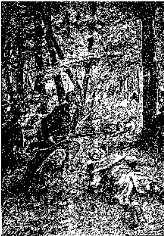
El hall, desde el lado del río.

Lo que vieron en cuanto divisaron Sport-terrace era cosa para quitarles toda esperanza.