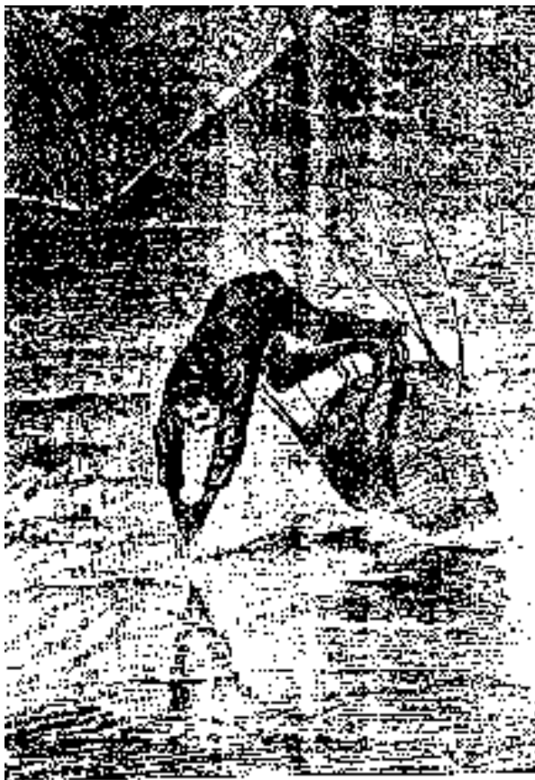
El guanaco se cayó al ser alcanzado por el fuego.

Doniphan examinó el animal, y vio que tenía en