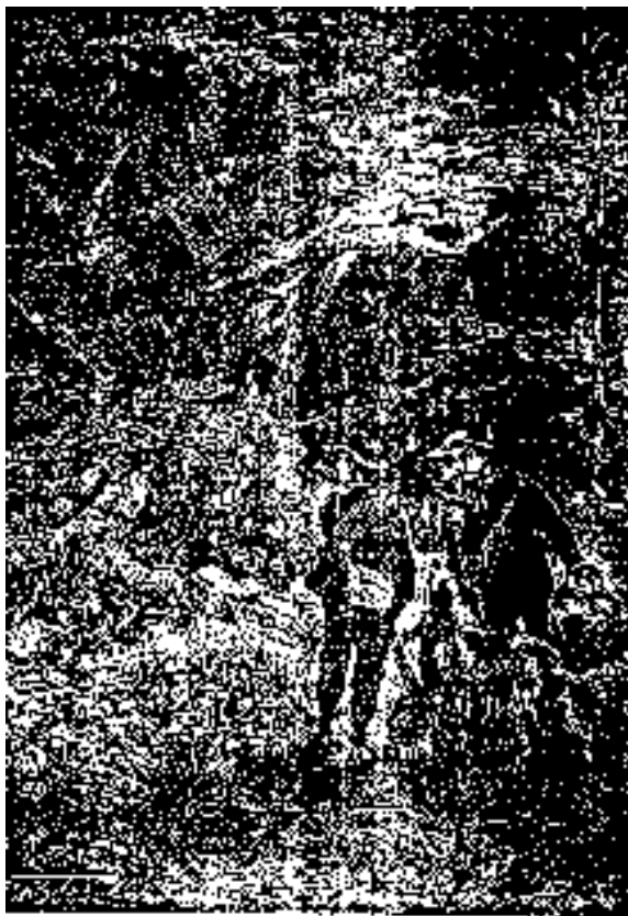
El pie de oro negro y otros los muestra en el espejito.

El orificio medía cinco pies de alto por dos de ancho; pero aparecía agrandado en seguida, presentando un ensanche de unos diez pies por veinte respectivamente, cuyo suelo estaba cubierto de arena muy fina y seca.