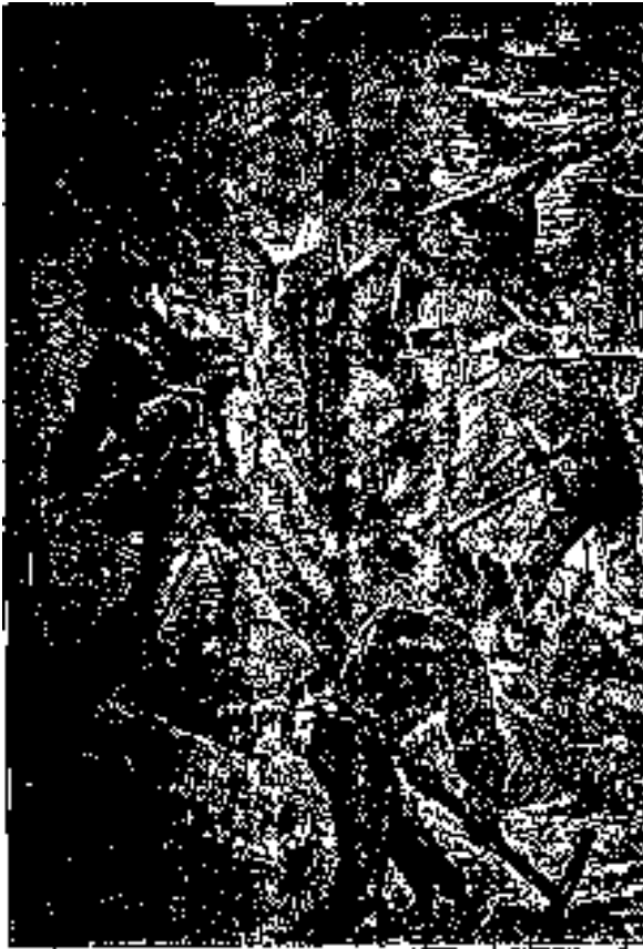
- ¡Con qué ardor juegan entre sí los niños!

El invierno había comenzado ya. ¿Cuál sería su duración? Cinco meses por lo menos, si la isla se encontraba a más altura que Nueva Zelandia.