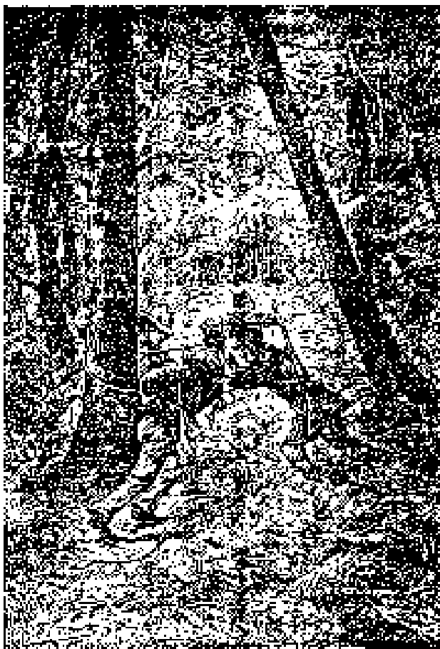
El guiso había terminado a las once.

A las once almorzaron, y para no perder tiempo, comieron los fiambres que llevaban consigo, poniéndose en seguida en camino, andando con mucha rapidez, y parecía que nada vendría a retrasar su marcha, cuando a eso de las tres un tiro sonó debajo de los árboles.