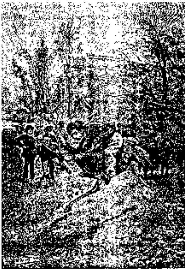
El vado no podía dar lugar a un vado ordinario.

Concluido el almuerzo, emprendieron de nuevo la marcha, y atravesaron el creek por un vado, sin necesidad del bote, cuyo servicio les hubiese consumido mucho tiempo.