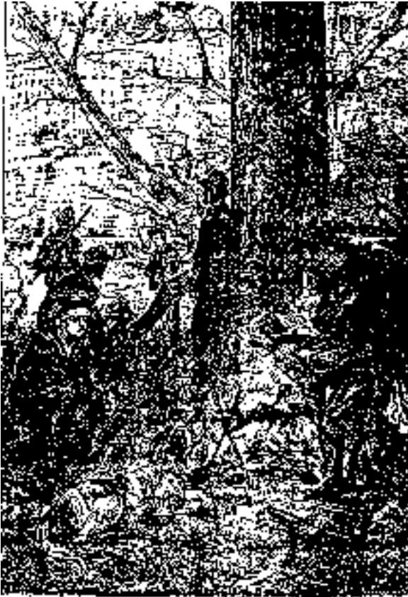
Mostrándose también el plá cozum guro , y Herveya agó co insularis .

-¡Este árbol es el trulca , si no me equivoco! exclamó. Es una fruta muy apreciada por los indios.