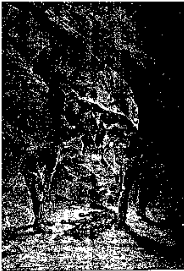
—(La de árbol) amigos Costar.

-Habla, Costar, habla, repuso Briant, animándole con el gesto. Estoy cierto de que tu idea es buena.