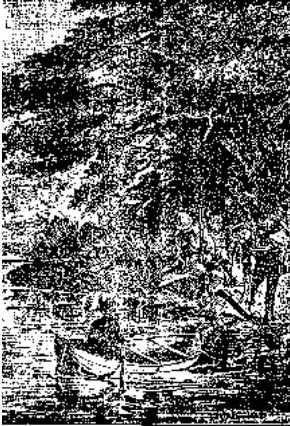
Donde se ve un bosque de árboles de la costa

Al día siguiente, 14 de Octubre, los cuatro muchachos partieron al amanecer, y tomaron el rumbo Norte, siguiendo el contorno del litoral.