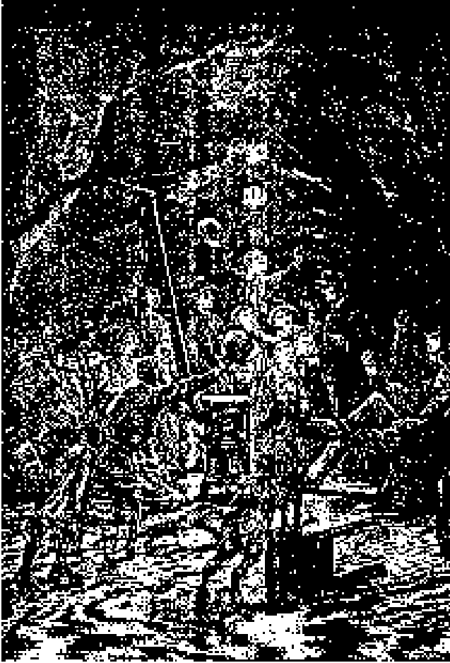
El Gran Salón. Vista desde el corredor central.

Aunque, por efecto de la inclemencia del tiempo, aun en las horas de recreo permanecían en el ball , la salud de los niños no se resintió por eso, merced a la renovación del aire que se hacía de una a otra habitación por el corredor. La cuestión