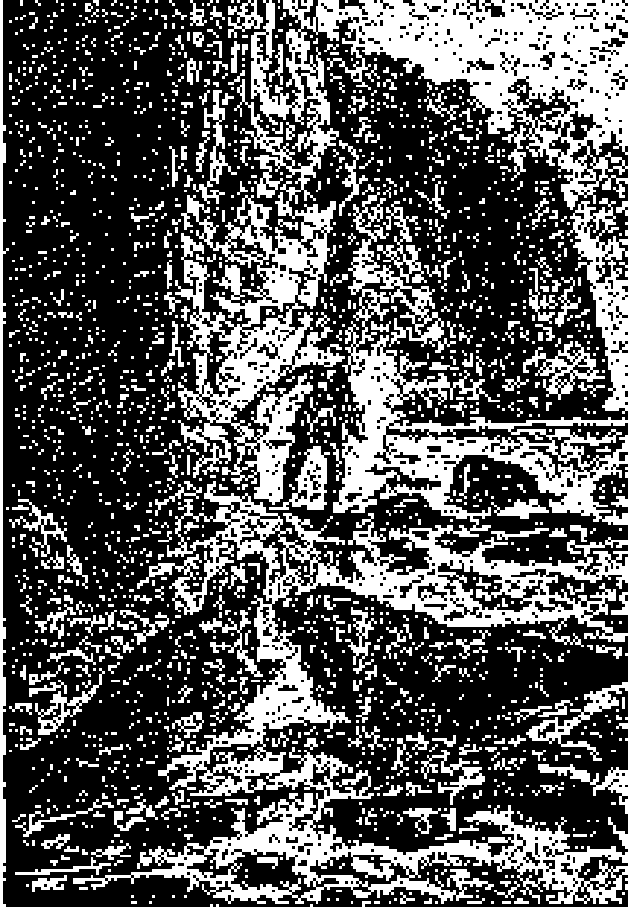
El mar y el cielo se unían para formar una sola línea.

Briant miró con atención todos los puntos de aquel ancho perímetro. ¿Era una isla? ¿Era un continente? No se atrevería a decirlo. Todo lo que