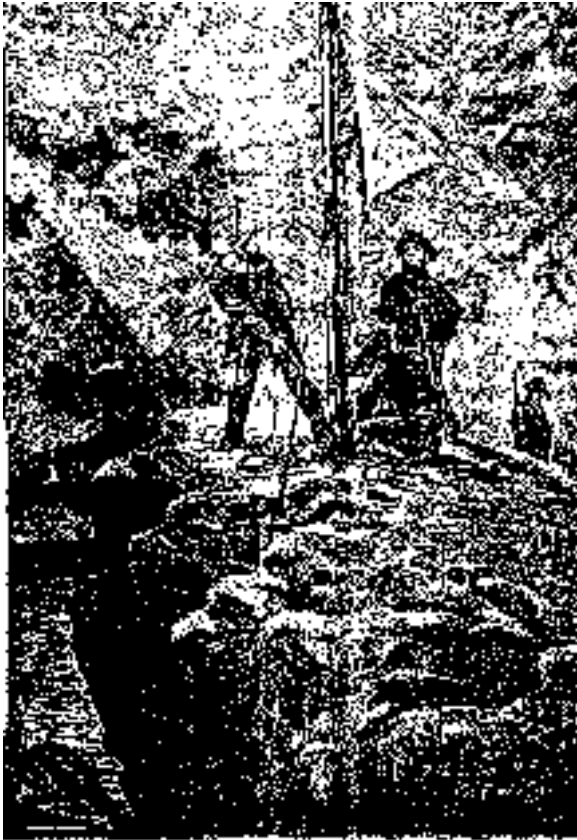
El hombre que se llama Service, y el que se llama...

-Pues bien, respondió el americano riendo; me extrañaría menos oírle hablar que verlo obedecer.