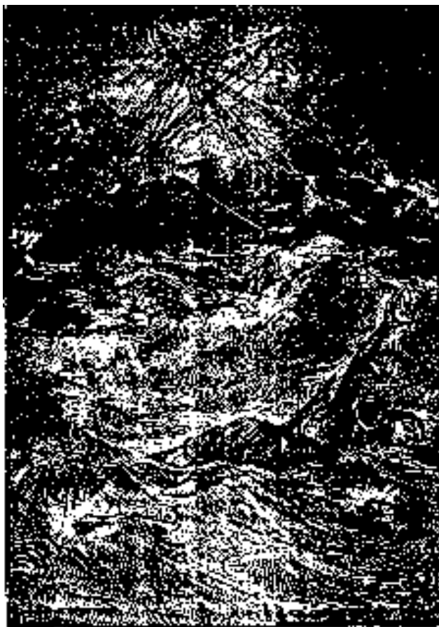
Salida a las montañas por carretera con la escuela de niños de la zona.

empleo a aquellas seis semanas, si se mira bajo el punto de vista de la salud, del esparcimiento, de la instrucción y de la moralidad de aquellos jóvenes.